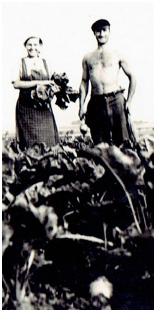
Rigoletto, prisonnier, à la ferme en Allemagne

épluchures de pommes de terre, des morceaux de betterave sucrière : pour se nourrir tout est bon !