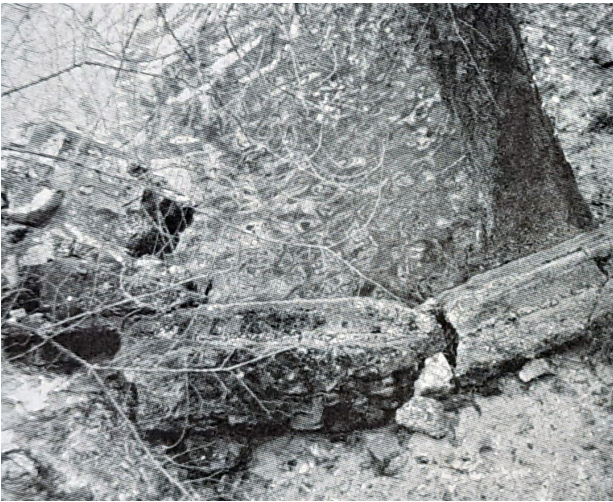
Pont de la Brague détruit (détail)