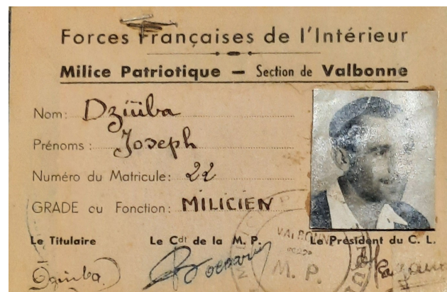
Carte de la Milice patriotique

La reddition de Joseph n'est pas passée inaperçue pour les Valbonnais. Le 28 août, une habitante qui tient son journal de bord durant cette période, écrit : « J'ai vu en revenant du pont de la Bague, après la visite du monument aux morts, que le (soldat) polonais qui était enrôlé malgré lui dans l'armée allemande et qui surveillait les travailleurs requis comme papa, mais qui s'était toujours montré brave pour les travailleurs, s'était constitué prisonnier. Il était vêtu de vêtements civils et amaigri. Quand les hommes de Valbonne l'ont reconnu ça n'a été qu'un cri unanime : qu'on ne lui fasse pas de mal, il était si