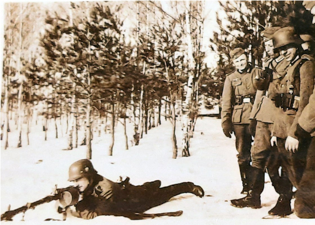
A l'entraînement dans la Wehrmacht

Puis il suit l'armée d'occupation en France avec le grade de sergent-chef. Direction le sud-ouest que l'armée allemande occupera à partir de novembre 1942. Son unité est basée à Castelsarrasin (Tarn-et-Garonne).