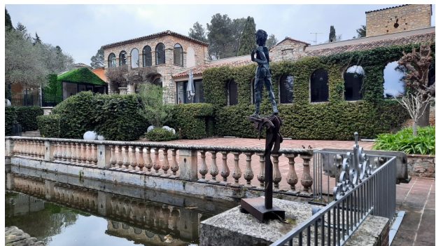
Le château Burton, devenu « Le Park » de Mougins