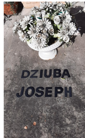
Tombe au cimetière de Pierrefeu à Valbonne