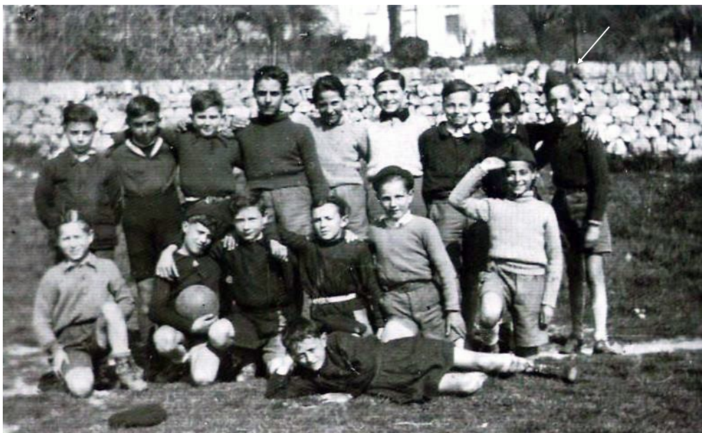
L'équipe de football 1942

Il y avait des Antillais stationnés du côté de la chapelle Saint-Bernardin. Et parmi eux, un qui était bien fatigué, bien malade. Ma mère lui portait de la soupe le soir pour qu'il se retape un peu. »