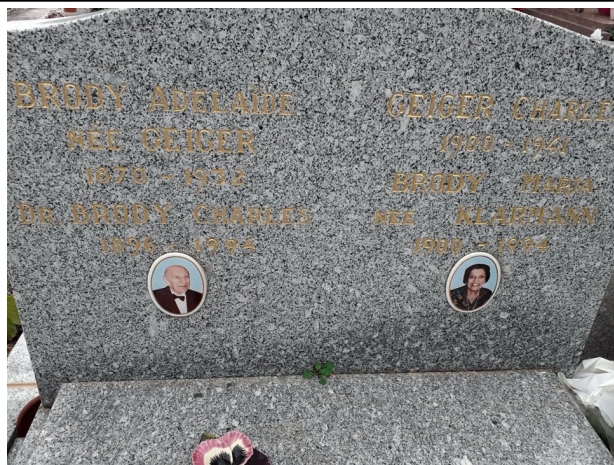
La tombe des époux Brody à Grasse

La villa Hélios, longtemps à l'abandon et livrée aux artistes de rue, a été transformée en appartements de luxe en 2019.